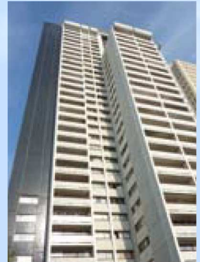
Exemple de copropriété accompagné

Les objectifs du COC sont d'inciter les propriétaires à réaliser un audit énergétique de leur immeuble et à les aider à financer les travaux préconisés par cet audit.